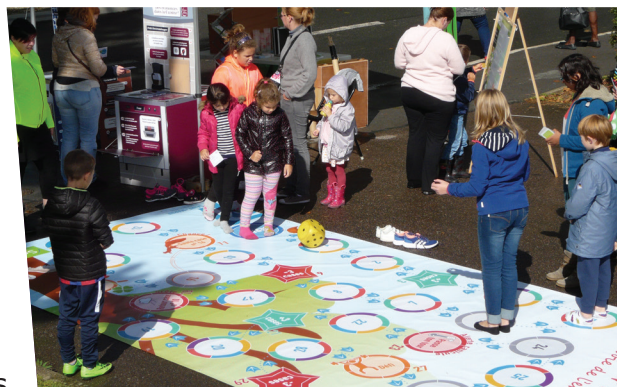
Stand économies d'eau et d'énergie, Rue aux enfants, Roissy-en-Brie, septembre 2017

Dans le cadre de la convention de partenariat avec la Communauté d'agglomération du Pays de Meaux (CAPM) , un atelier éco-gestes a été réalisé auprès des gardiens d'immeubles pour les sensibiliser aux économies d'énergie et aux bonnes pratiques dans le logement.