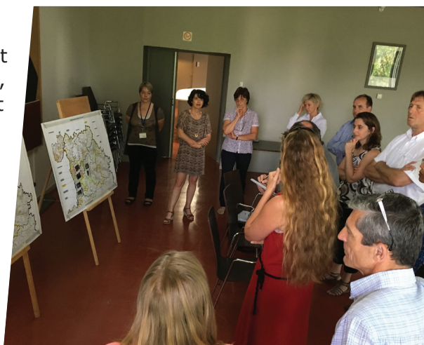
Séminaire Plan Climat Air Énergie Territorial, Torcy, 14 juin 2017

Seine-et-Marne environnement œuvre à cette action par ses actions de sensibilisation, information et conseils auprès des collectivités, élus, scolaires et du grand public.