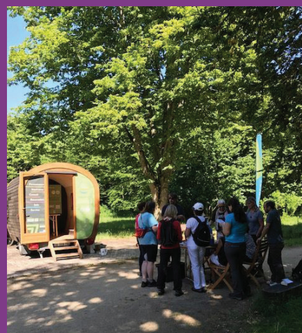
Atelier fabrication de produits d'entretien écologiques, Centre d'éco-tourisme de Franchard, Fontainebleau, 25 juillet 2017