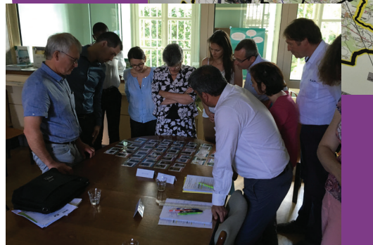
Séminaire autour de l'élaboration des PCAET, Fontainebleau, 30 mai 2017