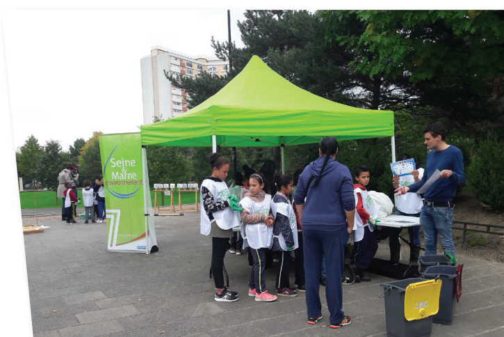
Opération Nettoyons la nature, Meaux, 22 septembre 2017

Retrouvez notre calendrier des animations sur notre site : www.seine-et-marne-environnement.fr