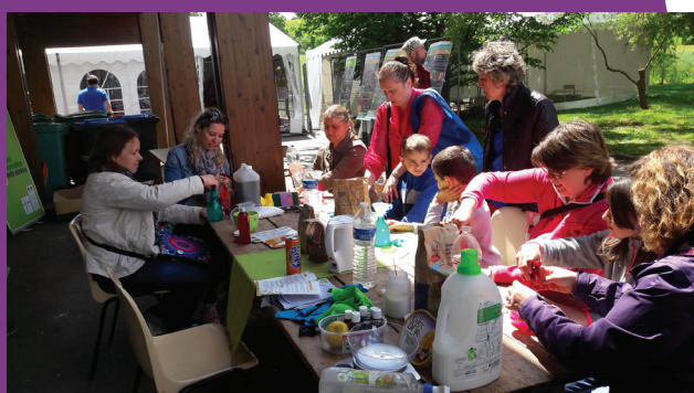
Atelier de fabrication de produits d'entretien écologiques, SMITOM, Monthyon