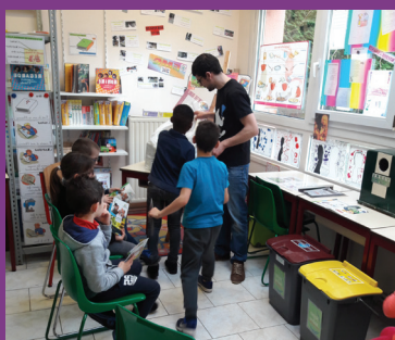
Animation scolaire autour des déchets, Pays de Meaux, 27 février 2017