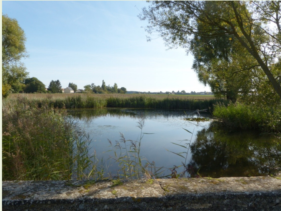
Mare communale de Boinville-Le-Gaillard (78)