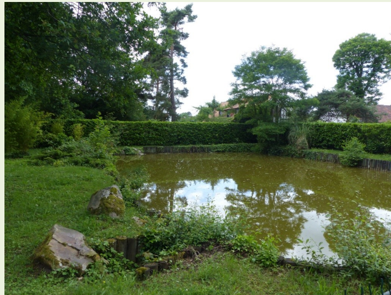
Mare communale de La Hauteville faisant l'objet d'un diagnostic CAUE/SNPN