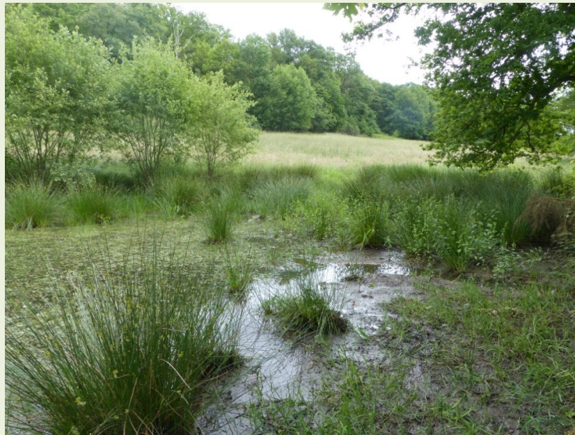
Mare prairiale à Mittainville (78)

Basées sur des retours d'expérience et des témoignages